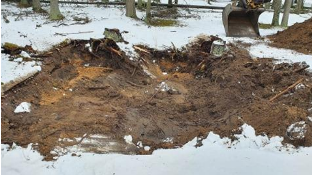
Figur 2. Provgrop med rester av kol och aska.