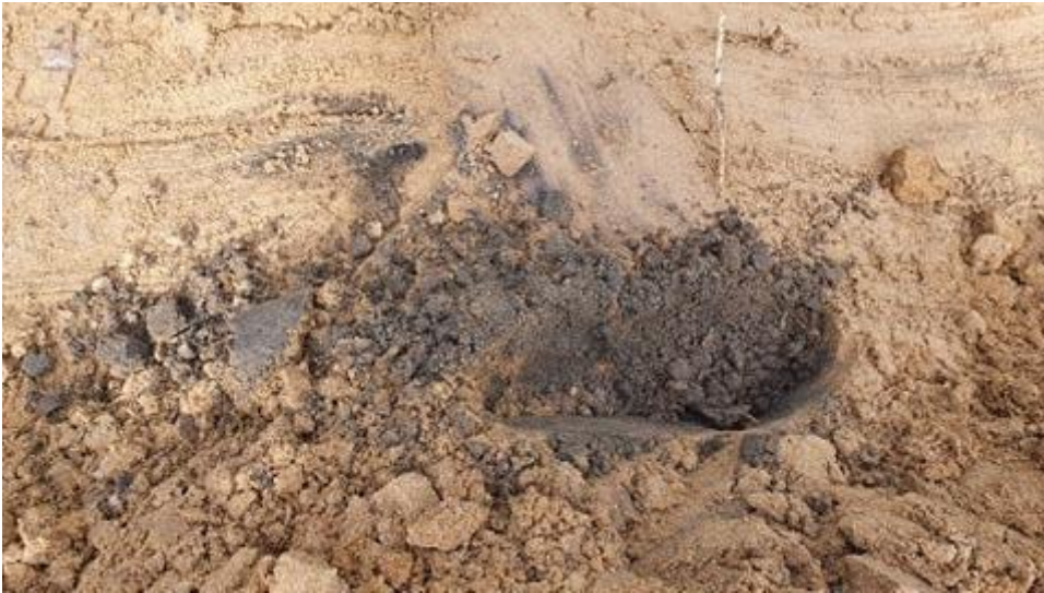
Figur 6.. Mörkt stråk i sanden, samt små kolrester, 0,3 mete runder markytan.