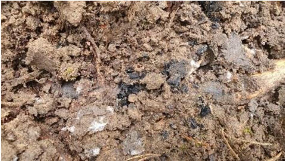
Figur 4. Kolrester påträffade i schaktbotten, 0,7 meter under markytan.