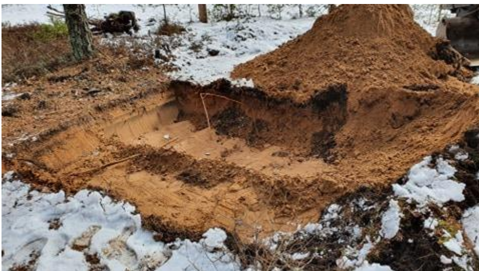
Figur 5. Naturlig finsand med små inslag av mörkare stråk och kolrester vid markytan.