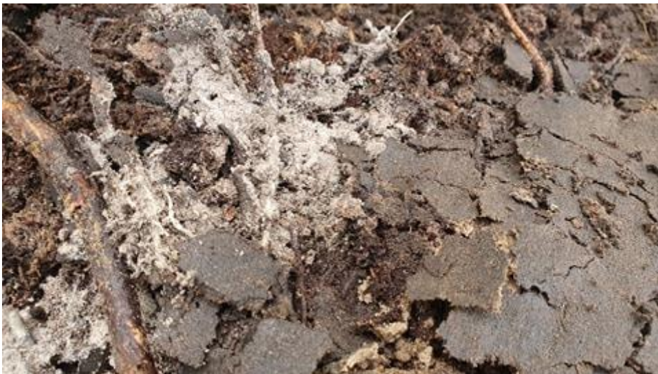
Figur 3. Aska påträffad i schaktbotten, 0,7 meter under markytan.